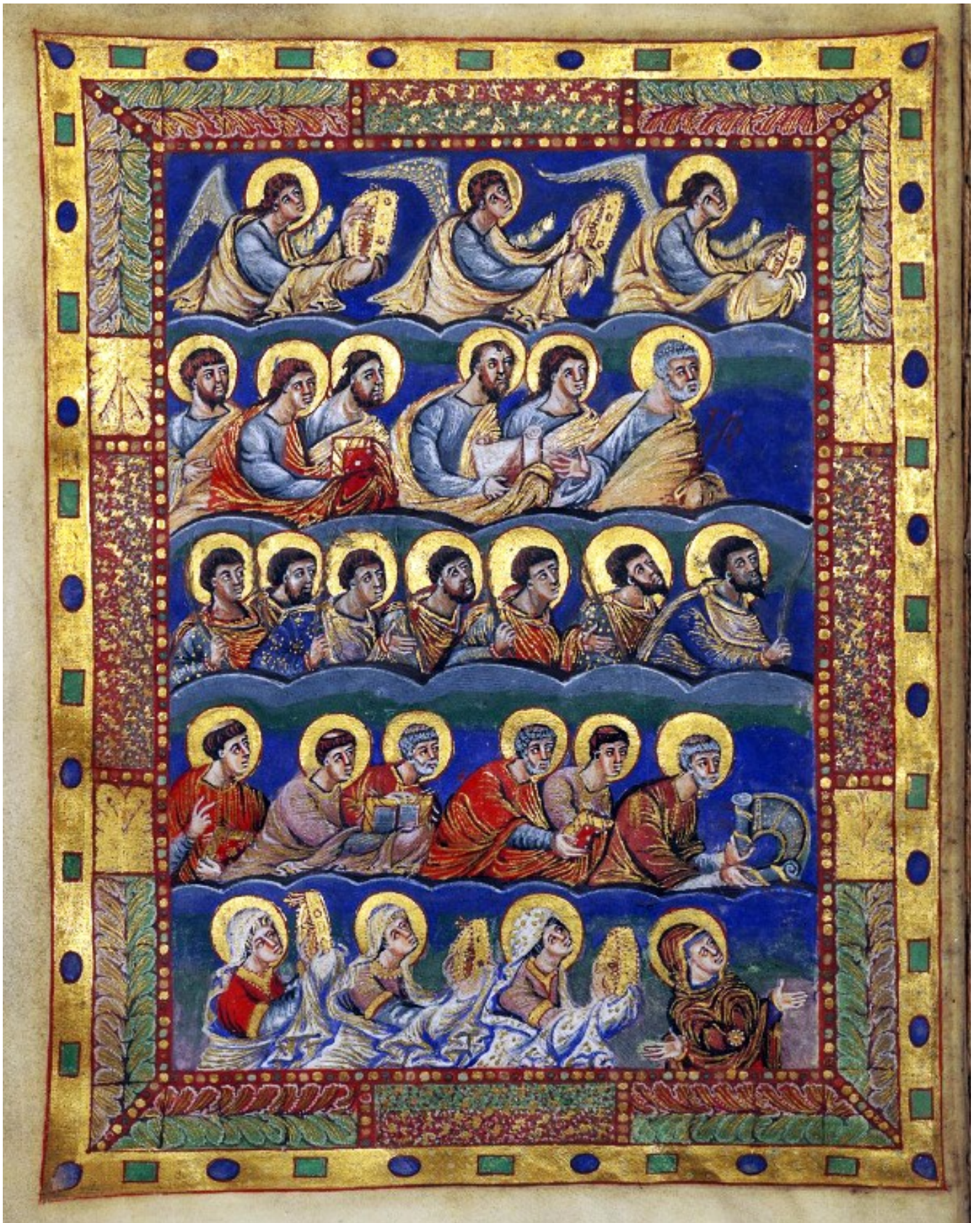
5v – La Cour céleste.