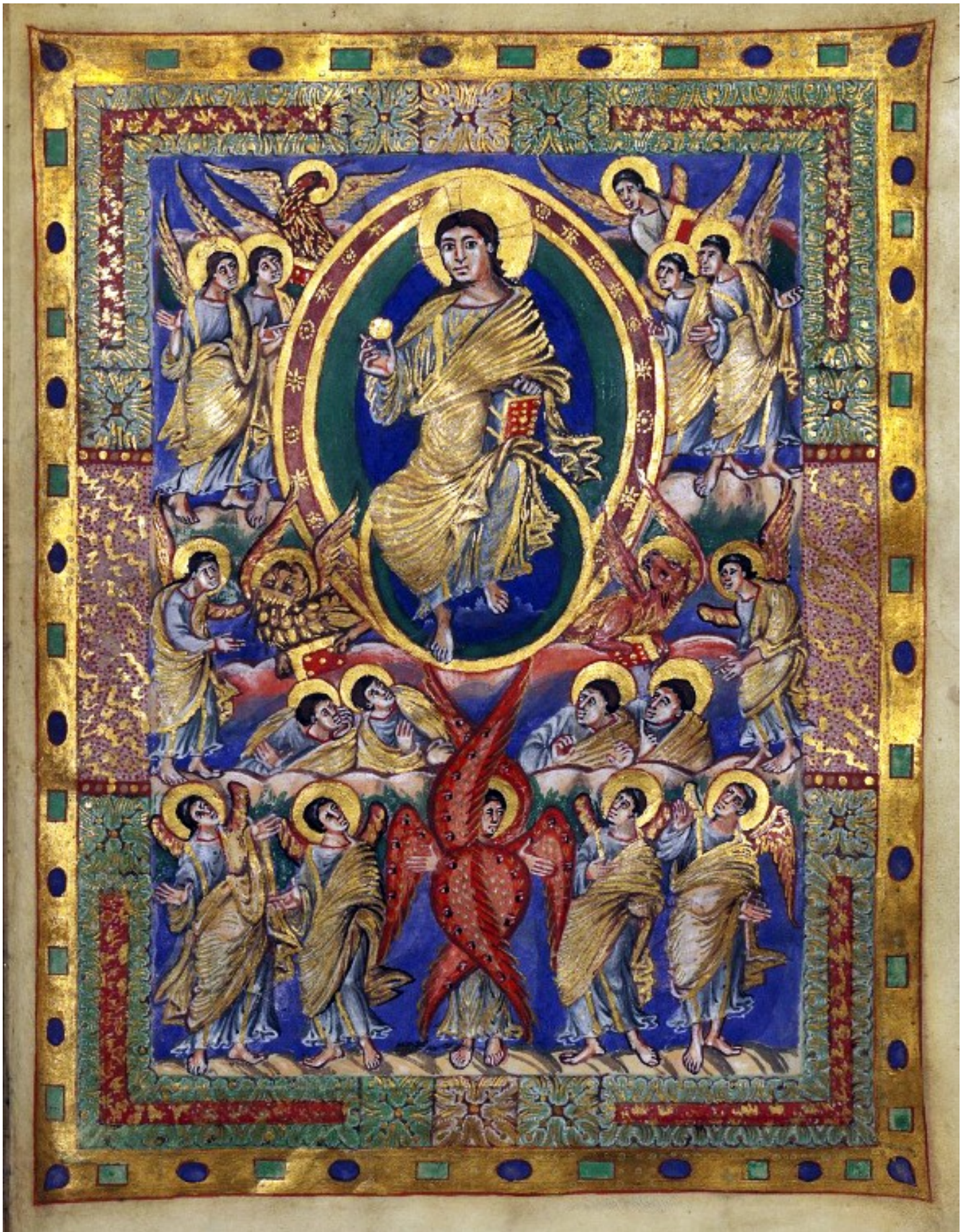
5r – Christ en majesté entre les symboles évangéliques et les anges.