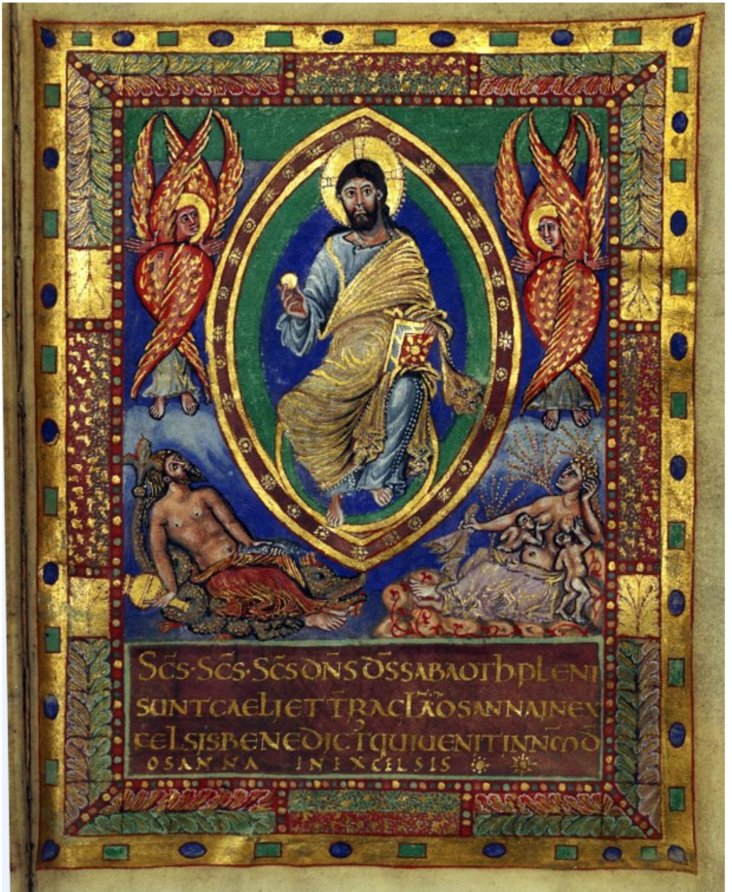
6r – Christ en majesté. Sanctus Dominus sabaoth...