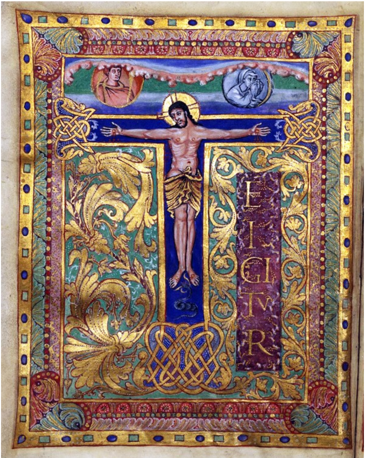
6v – Christ en croix.