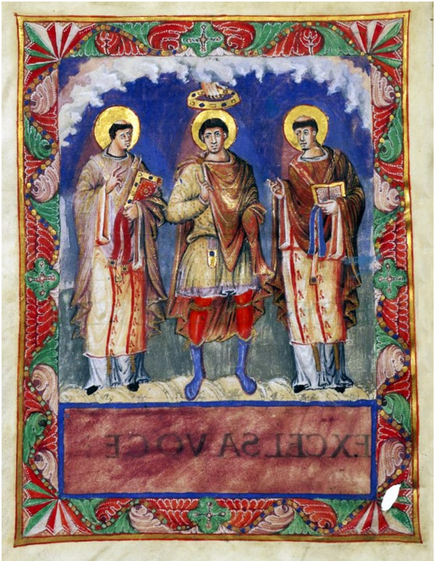
2v – Couronnement de Charles le Chauve ( ?), entre les papes Saint Gélase et Saint Grégoire le Grand.