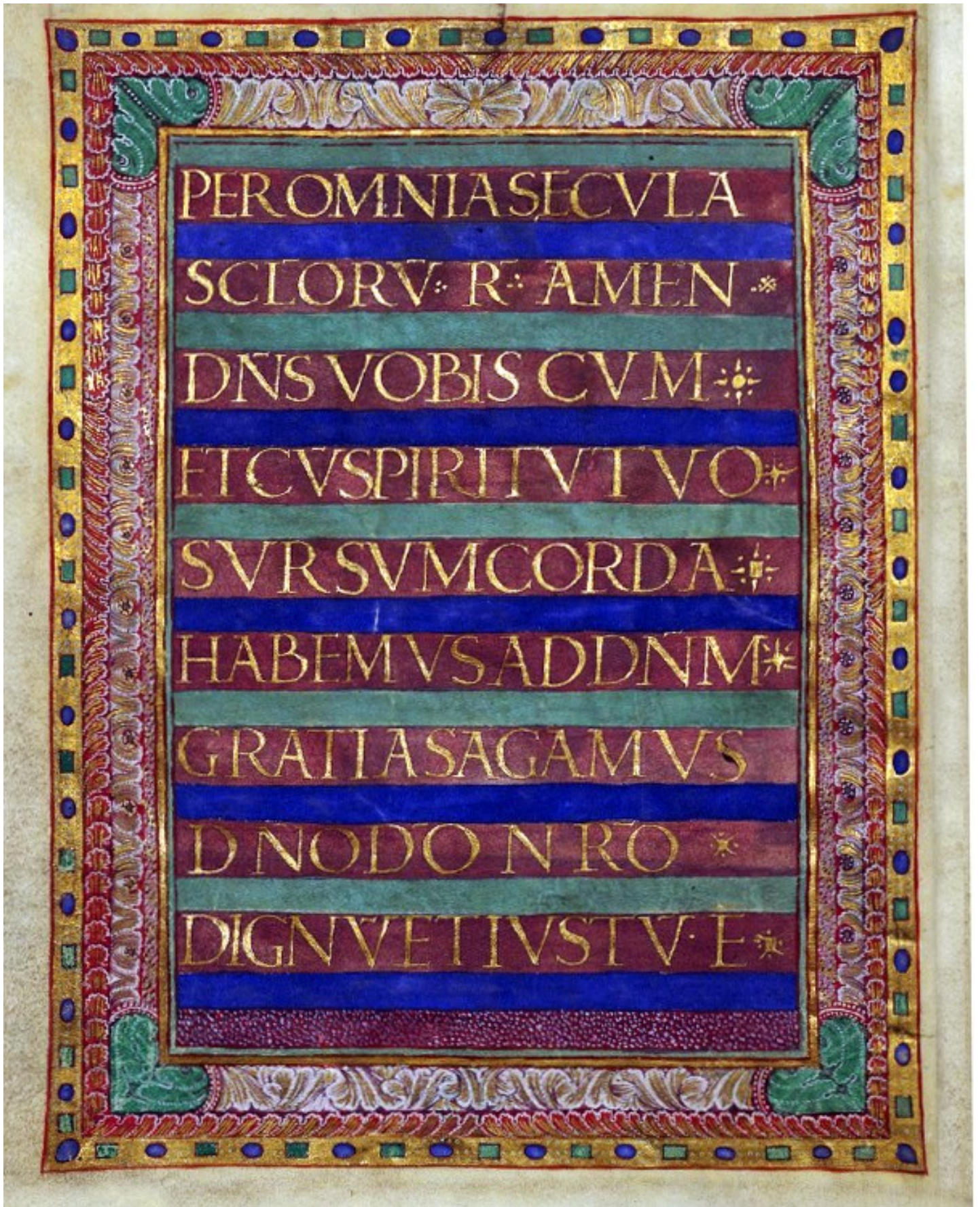
3v – Per omnia secula seculorum. Amen...