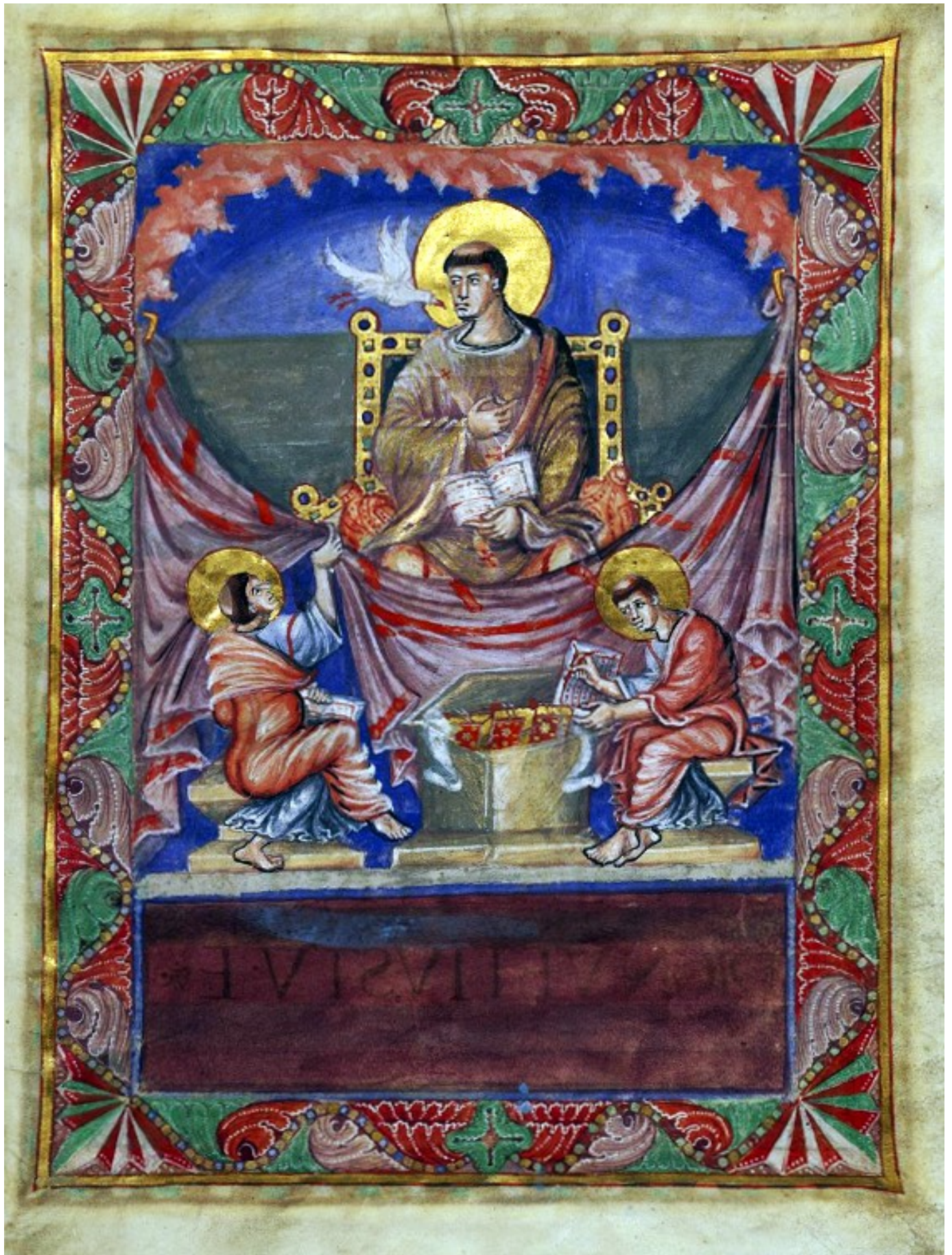
3r – Saint Grégoire sous l'inspiration de l'Esprit Saint.