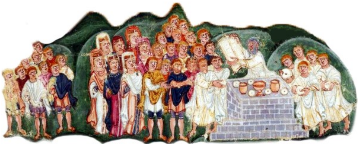
Détail du folio 76r – Moïse et les Tables de la Loi

Le manuscrit est arrivé en Gaule au VIII e siècle et fut conservé à Tours jusqu'au XIX e où il fut volé, puis vendu à Lord Ashburnham avant d'être acquis par la Bibliothèque Nationale de France (NAL2334).