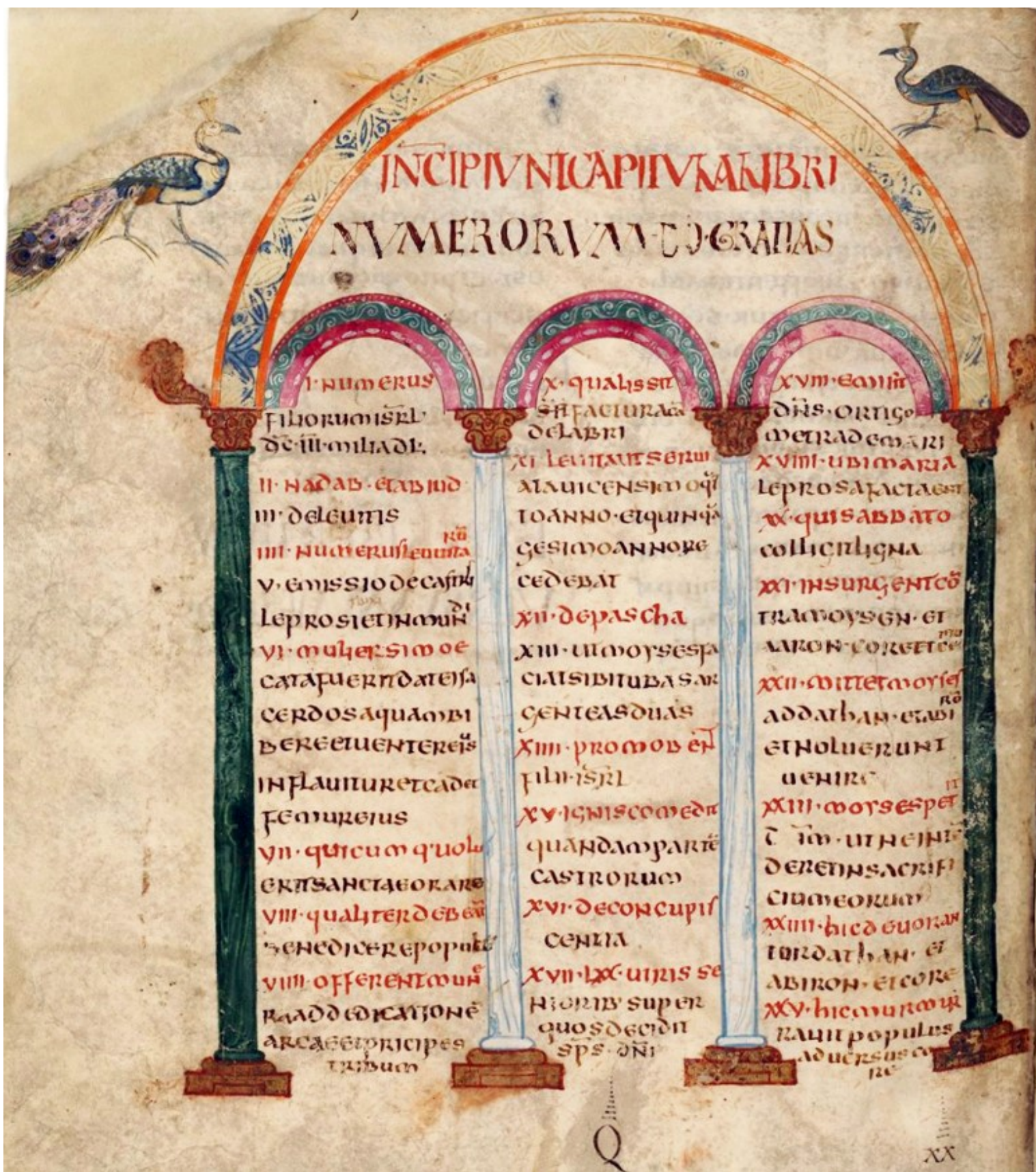
Folio 115v – Début du Livre des Nombres