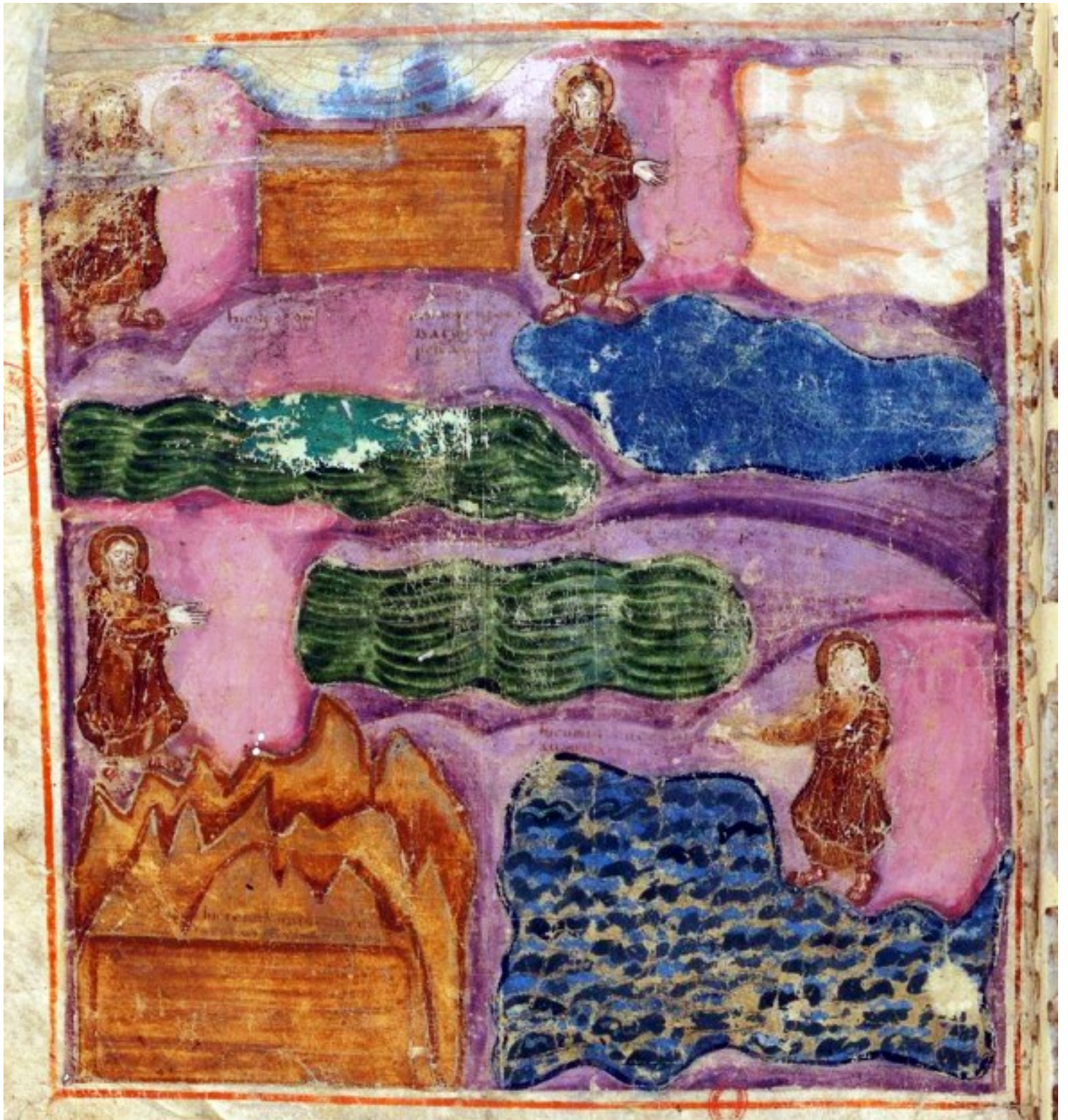
Folio 1v – Création du Monde