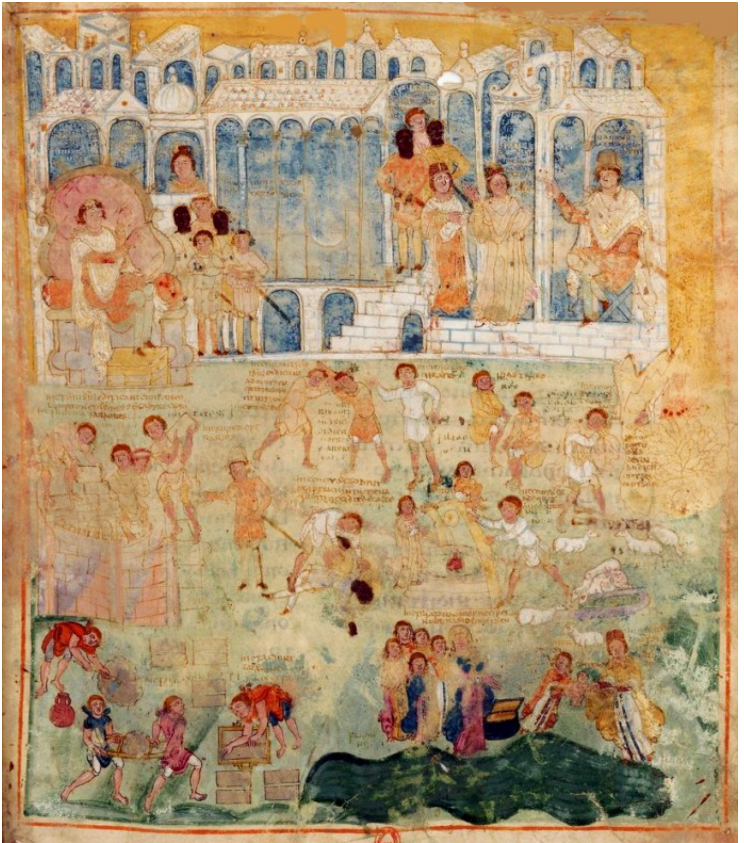
Folio 56r – Moïse jeune homme chez Pharaon qui a ordonné d'opprimer les Hébreux – Pharaon et les sages-femmes. Moïse confié à sa propre mère