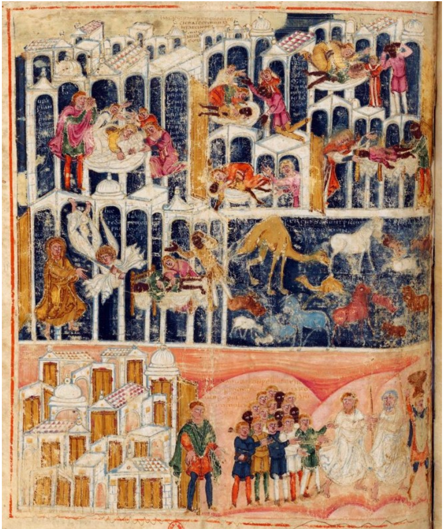
Folio 65v – Les plaies d'Égypte : les premiers-nés