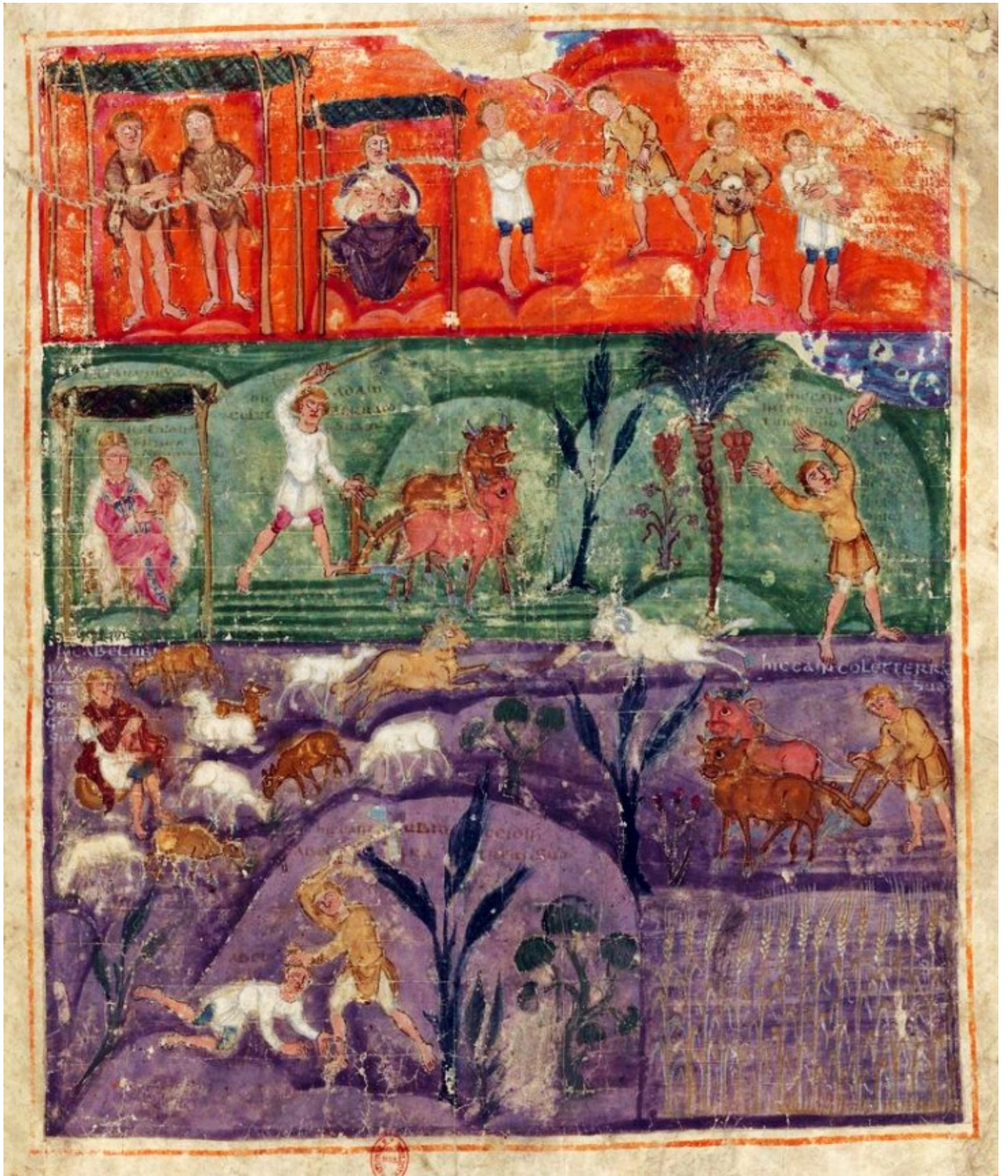
Folio 6r – Travaux d'Adam et Ève – Abel tué par Caïn