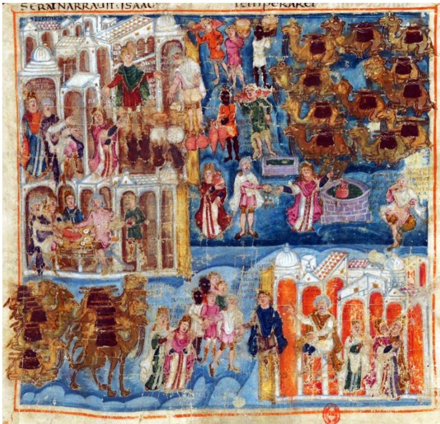
Folio 21r – Sara accueille Rébecca