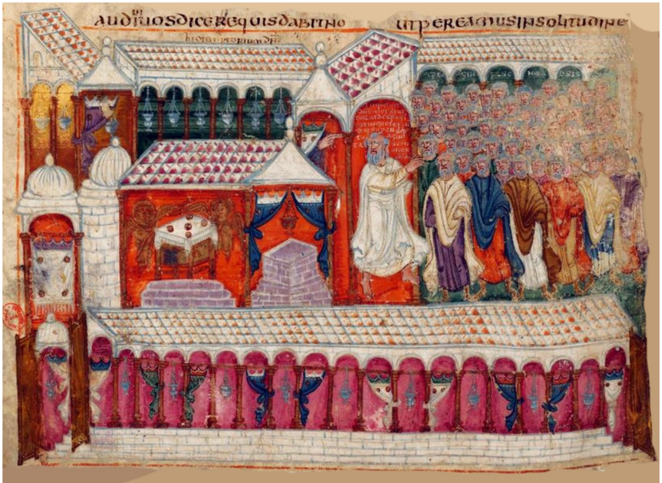
Folio 119v – Moïse et les Hébreux