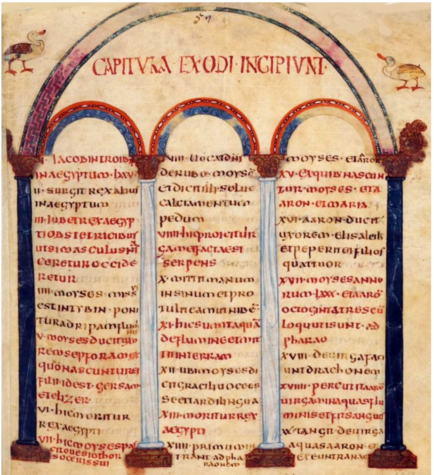
Folio 51r – Livre de l'Exode