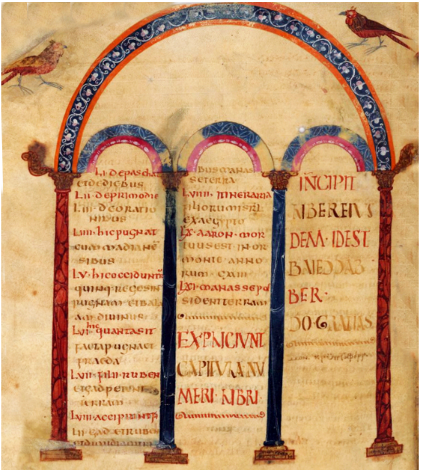
Folio 116v – Début du Livre du Deutéronome