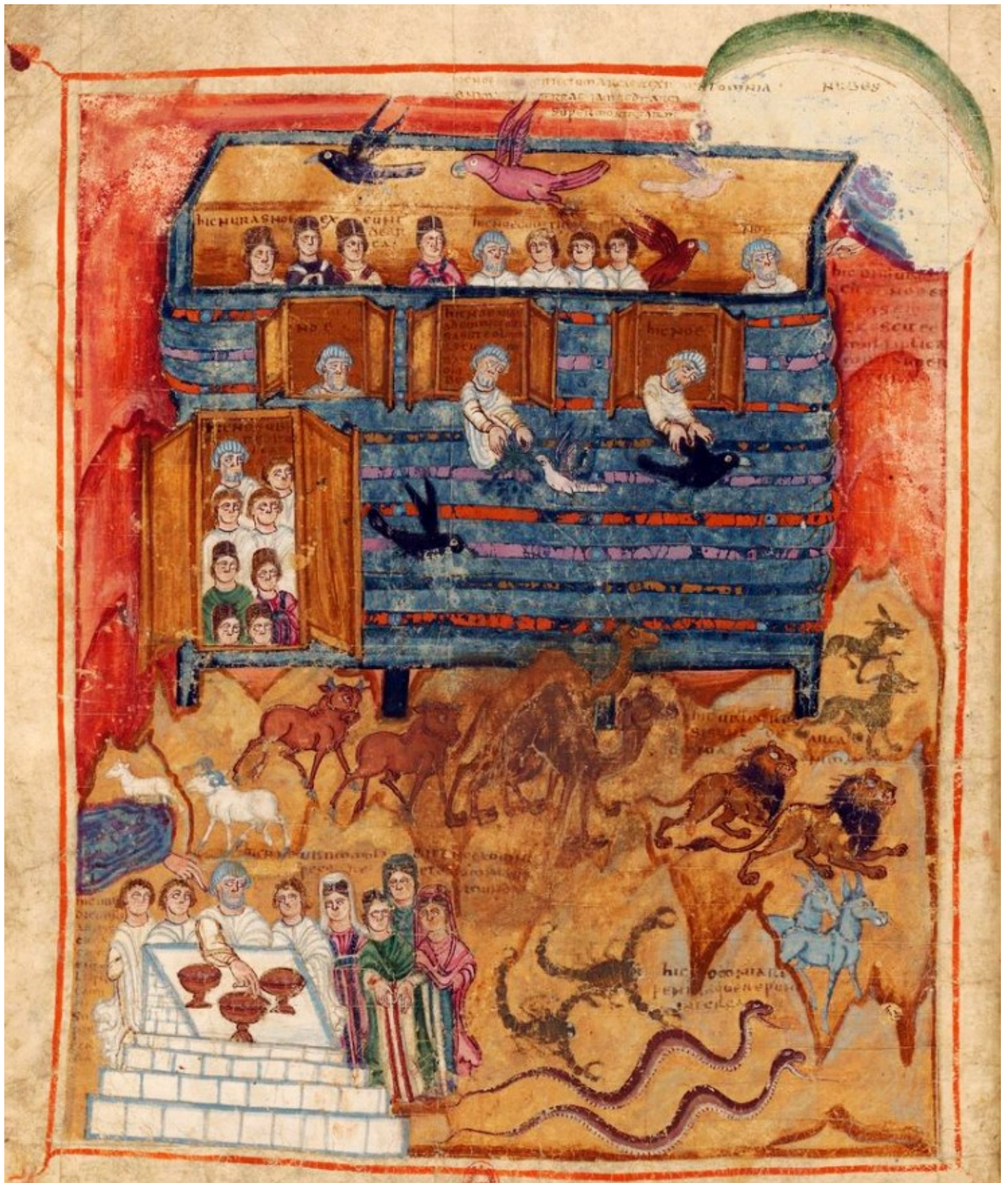
Folio 10v – Sortie de l'Arche