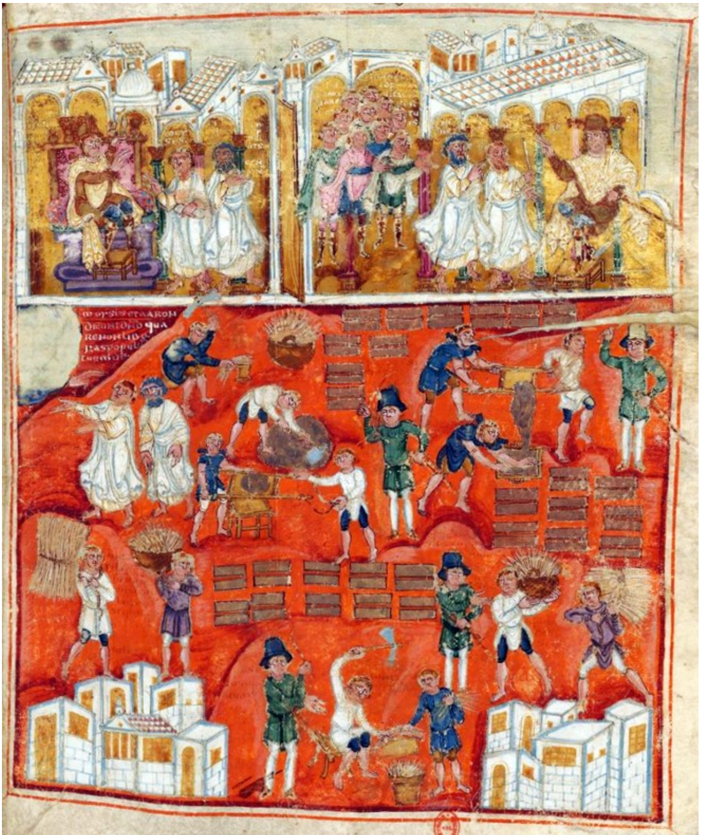
Folio 58r – Moïse et Aaron chez Pharaon – Les esclaves hébreux