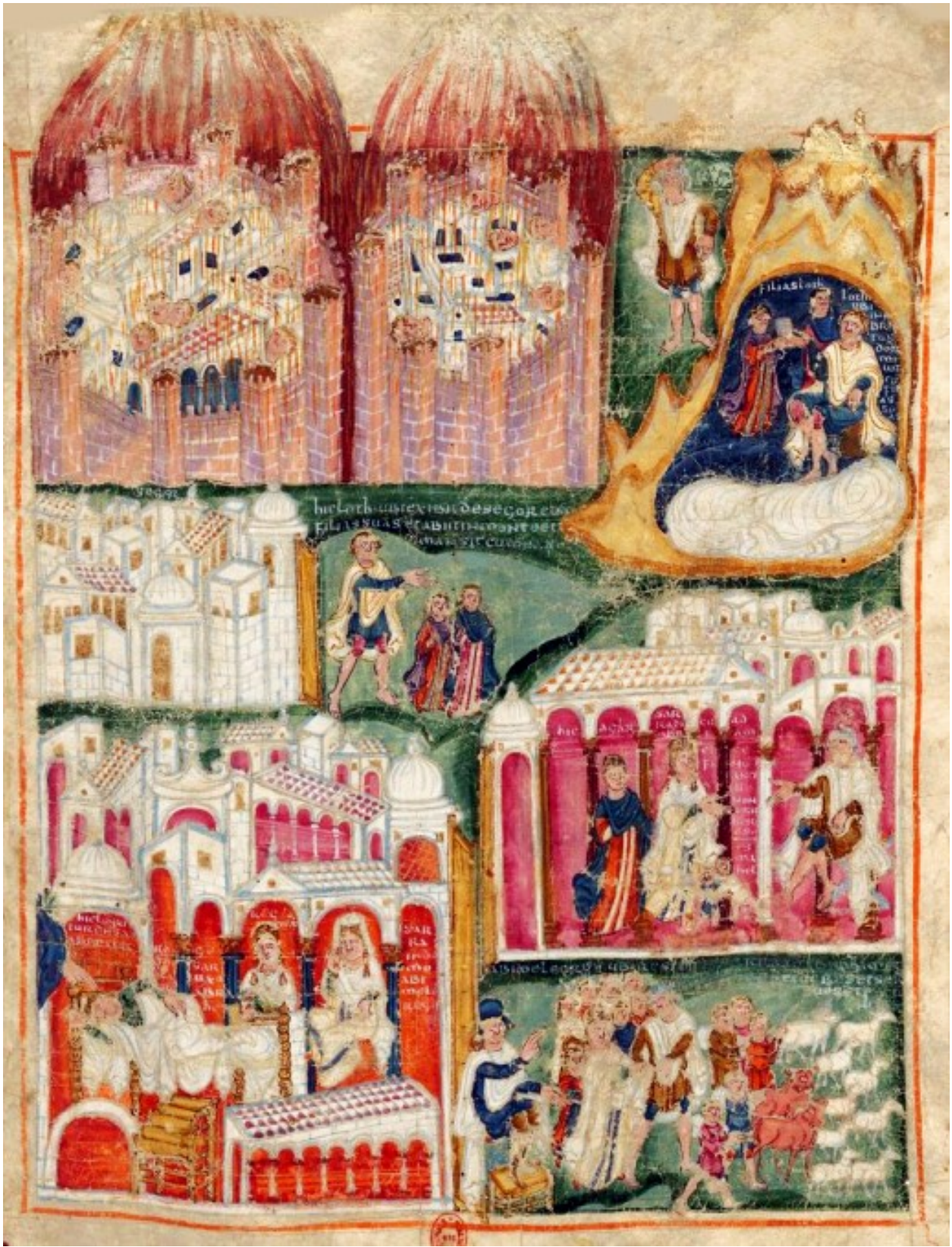
Folio 18r – Songe d'Abimelek, Sara demande le renvoi d'Agar - Sodome et Gomorrhe