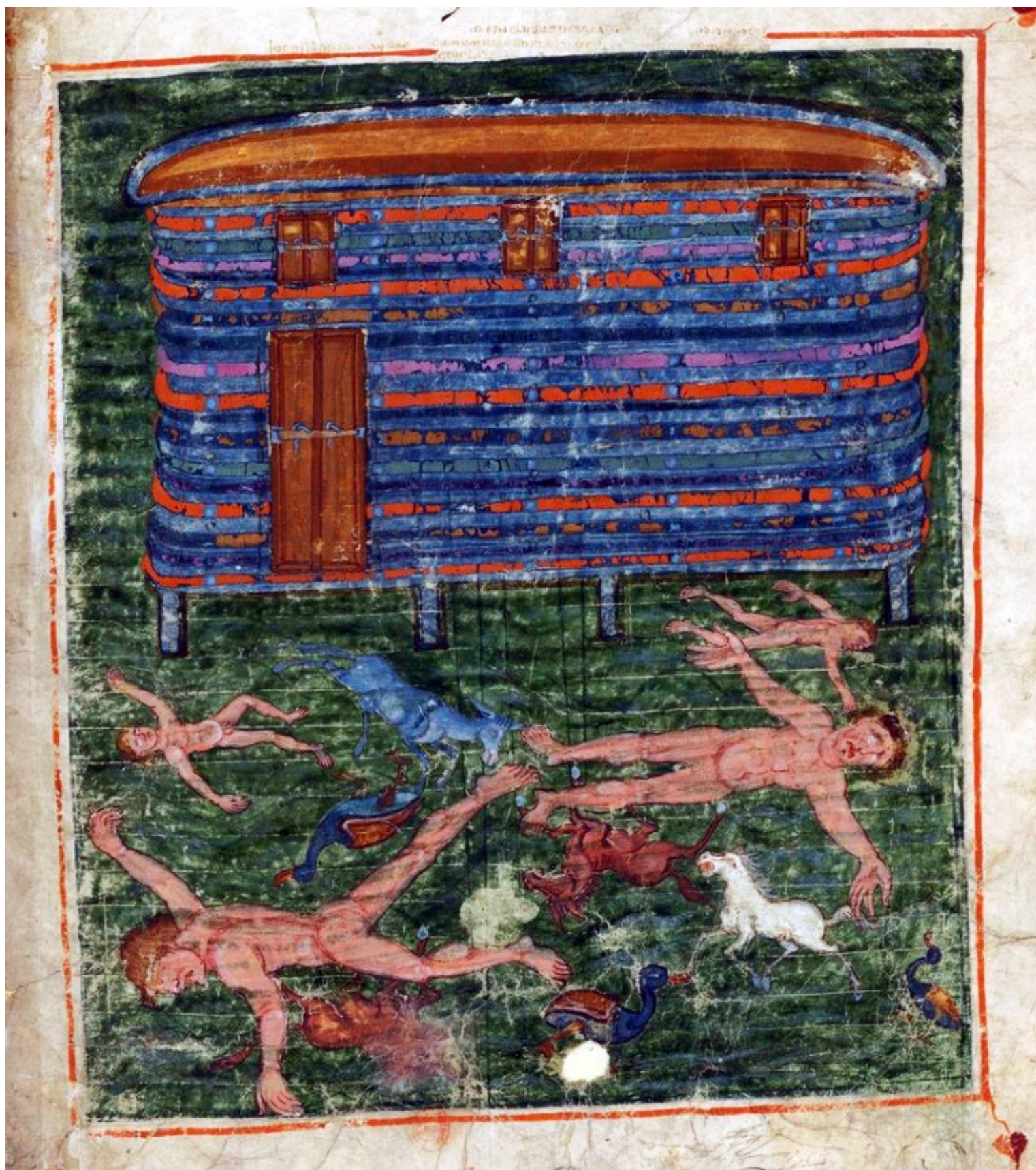
Folio 9r – Le Déluge et l'Arche de Noé