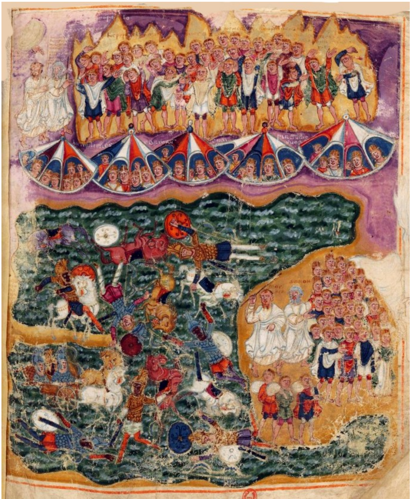
Folio 68r – La traversée de la Mer Rouge