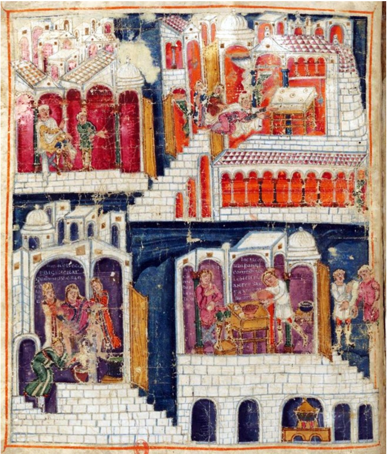
Folio 22v – Naissance d'Esau et Jacob – Esau cède son droit d'aînesse