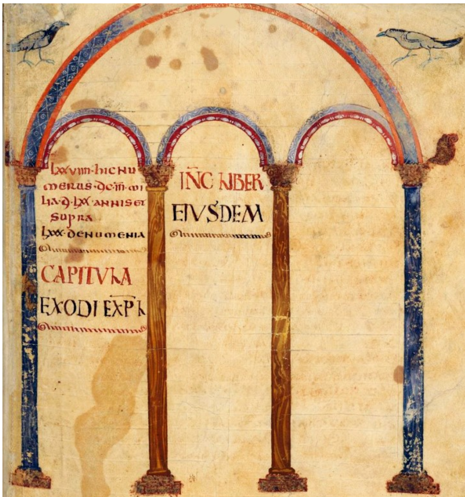
Folio 53r – Fin de l'Exode – Début du Livre du Lévitique