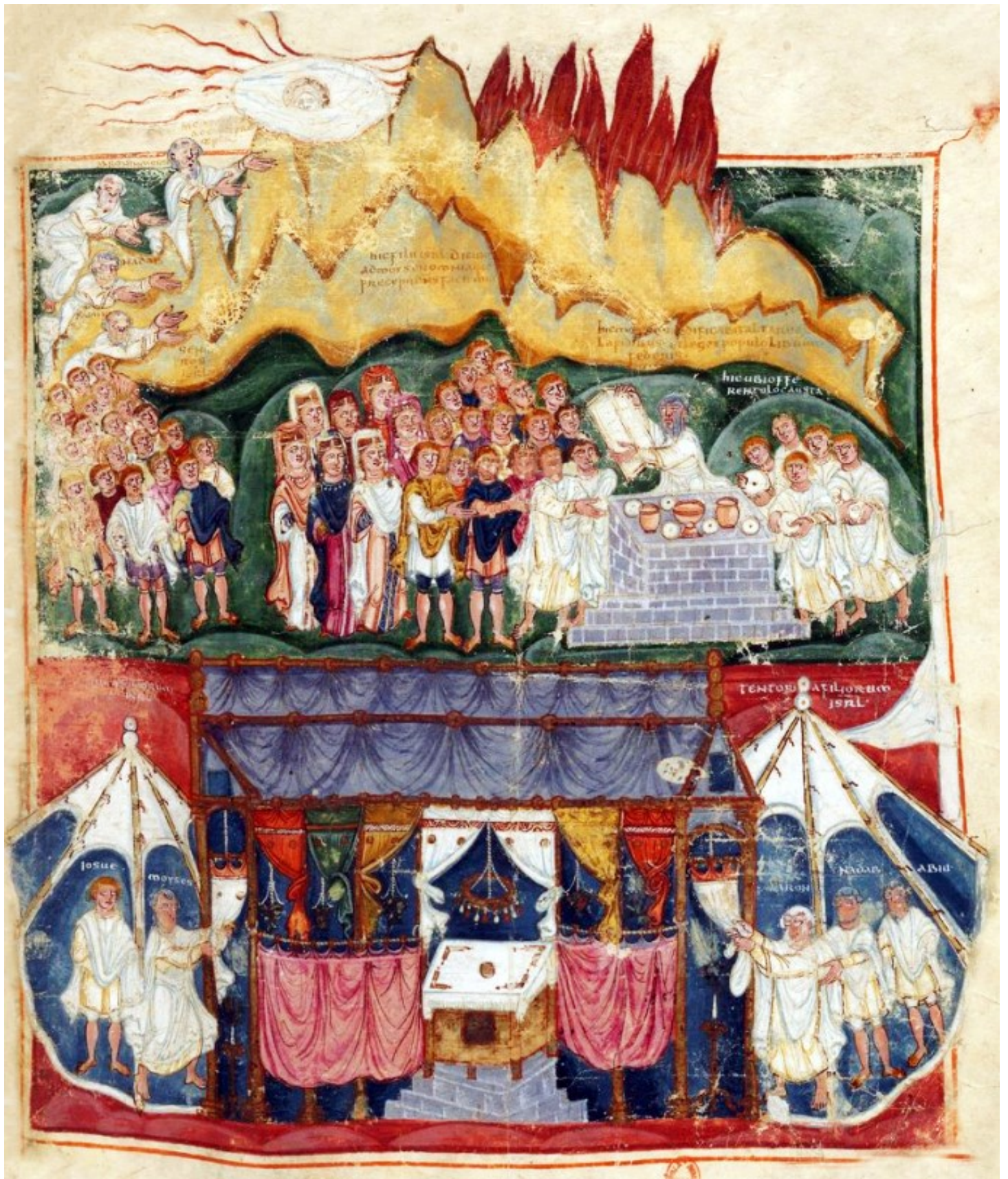
Folio 76r – Au Sinai – Les Tables de la Loi