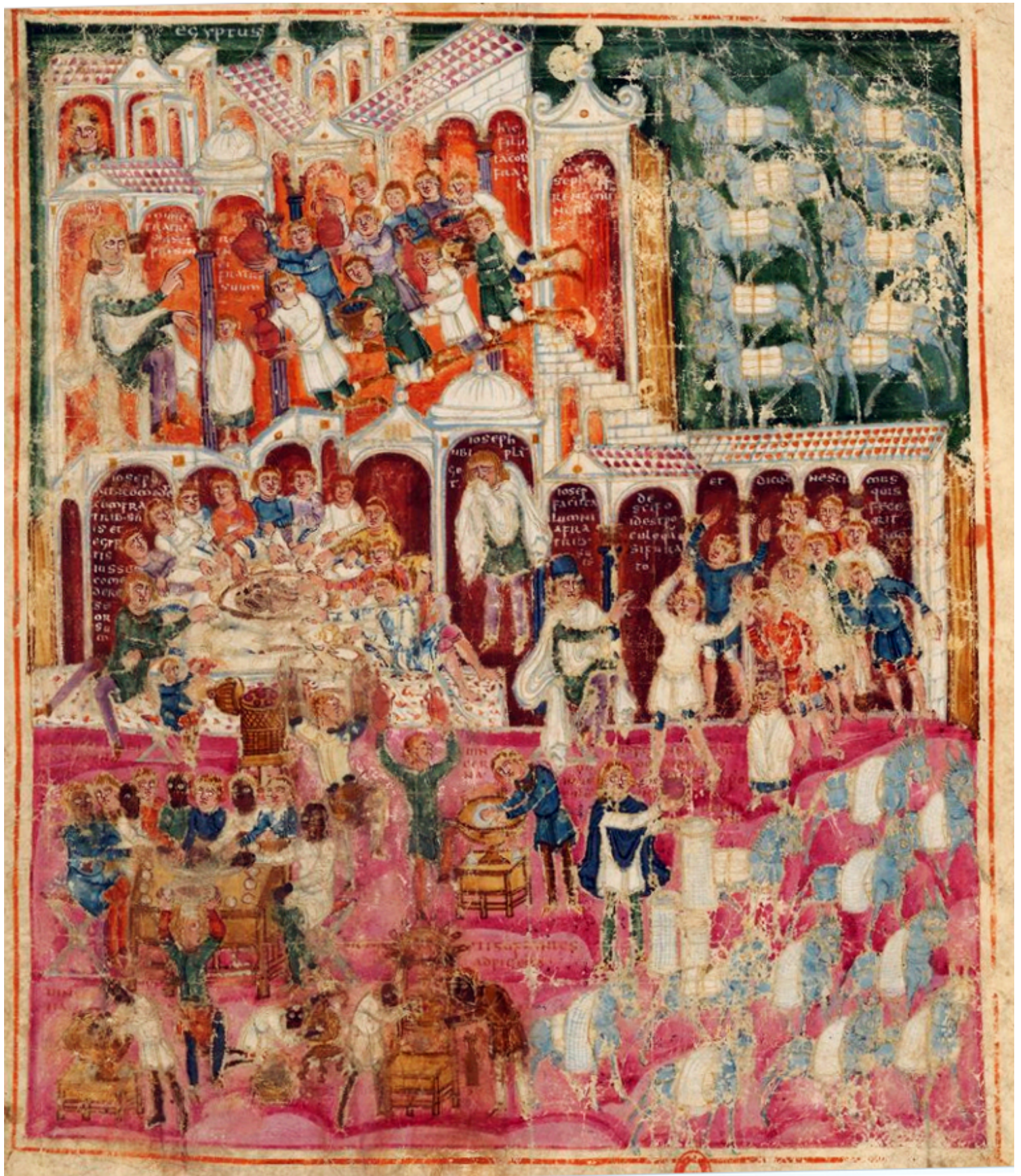
Folio 44r – Jacob pleure d'émotion – Joseph en Égypte