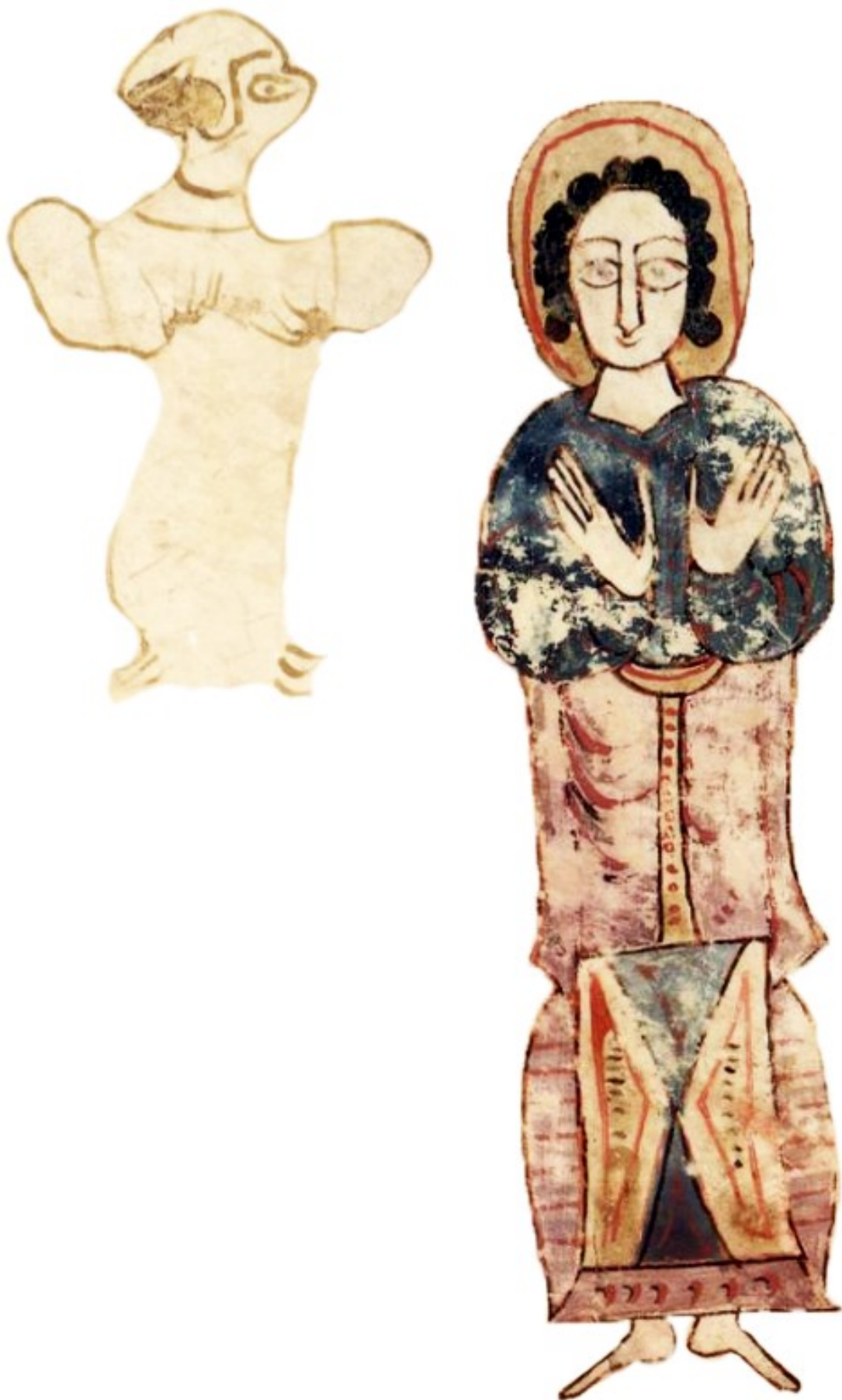
Folio 22v (le dessin grossier figure dans le manuscrit)