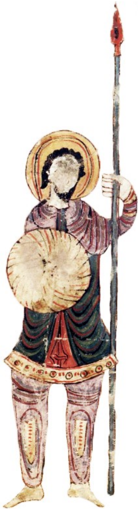
Folios 19r, 26v