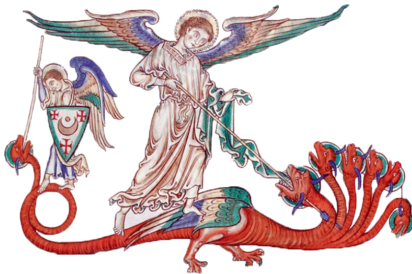
Illustrations tirées d'un ouvrage de la BNF : Apocalypse glosée en français , un peu avant 1250 (Gallica).